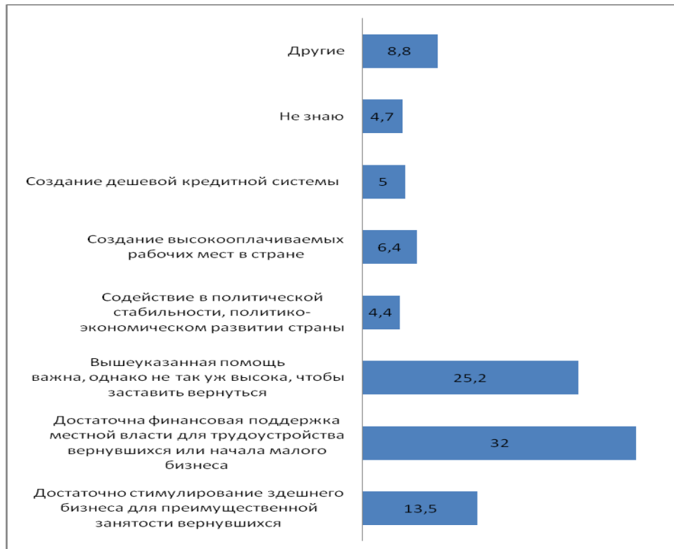
Диаграмма 7. Мнение вернувшихся мигрантов относительно наиболее эффективного пути содействия возвращению (%)

Явно выявилось, что наиболее эффективным направлением содействия возвращению является упрочение позиции вернувшихся на рынке труда Грузии и ее всесторонняя поддержка.