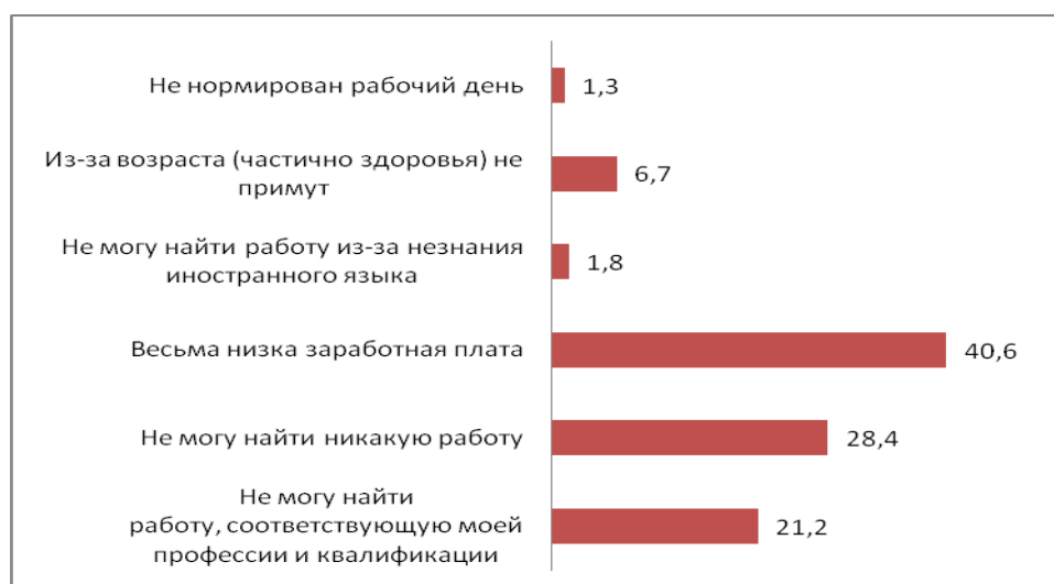
Диаграмма 1. Распределение ответов возвращенных мигрантов на вопрос: “С какими трудностями сталкиваетесь при поиске работы?” (%)

Несмотря на большие усилия, в процессе трудоустройства вернувшиеся сталкиваются с большими трудностями, что сдерживает их занятость (см. Диаграмма 1 ).