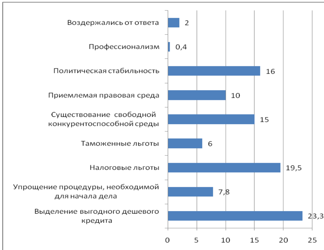
Диаграмма 5. Распределение ответов возвращенных мигрантов по условиям осуществления собственного бизнеса в Грузии (%)

В деле реинтеграции мигрантов огромное значение имеет эффективное направление накопленных ими за границей средств для повышения экономической активности их и других вернувшихся. На вопрос о том, что достаточно для того, чтобы ремигрированный осуществил здесь собственный бизнес, ответы распределились следующим образом (см. диаграмма 5)