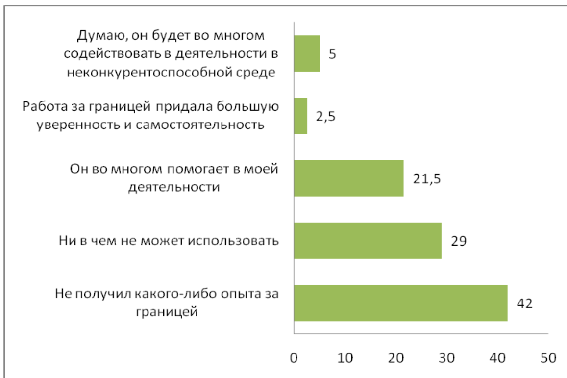
Диаграмма 6. Распределение вернувшихся мигрантов по ответам относительно содействия полученного приобретенного за границей опыта теперешней деятельности (%)

Значительная часть опрошенных (42%) считает, что за границей соответственно их образованию не смогли приобрести какого-либо опыта. Ведь они там были заняты на вторичном рынке труда, в результате чего вернулись с характерными для вторичного рынка труда умениями и навыками. Исходя из этого, имеется определенное число респондентов, которым в их теперешней