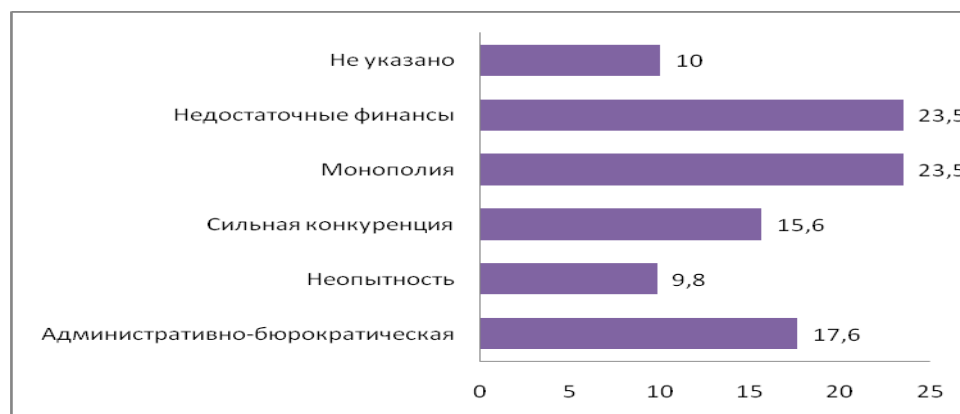
Диаграмма 3. Распределение возвращенных мигрантов по ответам на вопрос: “В основном с какими трудностями столкнулись при осуществлении Вашего бизнеса ? “ (%)

Вовлеченных в малый бизнес вернувшихся отмечают (81,3%), что им в осуществлении этого проекта никто из других организации не помогал. 18,7%-м же оказали помощь в выделении территории для предприятия. Зато большую помощь оказывают члены семьи, которые находились на родине (60%). 7% - помог работающий за границей член семьи, 12% - знакомые и друзья (близкие, родственники), а незначительной части никто не помог.