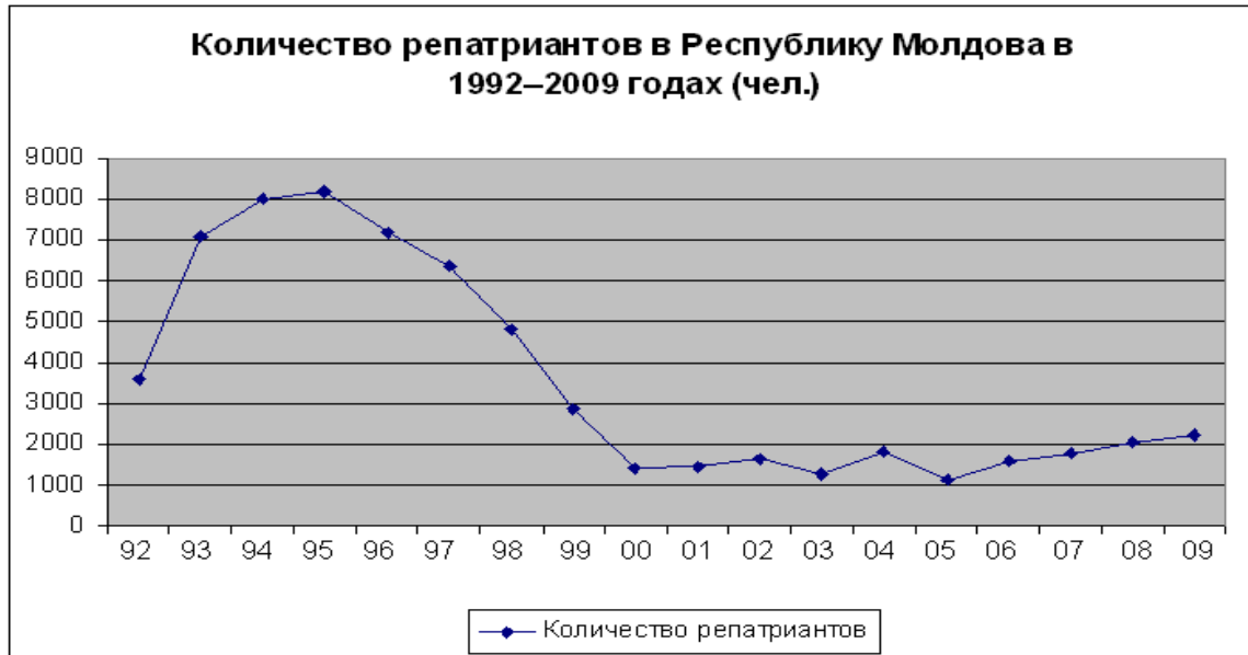
Рис.5. Динамика потоков репатриантов в Республику Молдова в 1992-2009 гг. (человек) 6

Первоначально (1992-1997 гг.) в республику репатрировалось по 7–8 тыс. человек. Это объясняется в большей степени патриотическими чувствами, желанием жить на родине. Сложная социально-экономическая ситуация в стране вынуждает людей руководствоваться в большей степени материальными интересами. Происходит резкое снижение (в 5-6 раз) количества репатриантов в период 1998-2009 гг.